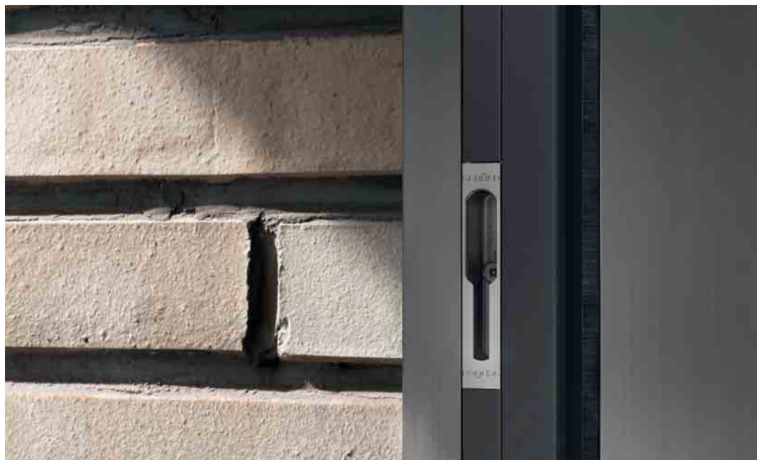
Beschlagsoption mit flächenbündiger Verriegelung im Blendrahmen Fittings option with flush-fitted locking in the outer frame

Die Schüco Schiebesystem-Plattform ASE 60/80 ist derzeit das einzige System am Markt, bei dem das Beschlagsystem sowohl als Schiebe- als auch als Hebe-Schiebe-Beschlag eingesetzt werden kann – und dies in zwei Varianten.