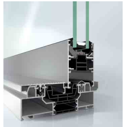
Blendrahmen mit anextrudierten Rinnenprofilen reduzieren Fertigungsschritte und Artikelanzahl Outer frames with co-extruded gutter profiles reduce the number of fabrication steps and articles

In die Verarbeitung der Schüco Schiebesystem-Plattform ASE 60/80 haben einige neue Prinzipien und Details Einzug gehalten. Im Gegensatz zu den Vorgängerserien ist die gesamte Verarbeitung in beiden Bautiefen nun identisch. Damit ist die projektspezifische Auswahl der richtigen Bautiefe für die Fertigung flexibler geworden. Die Eckverbinder können wahlweise mit Nägeln oder Schrauben verarbeitet werden. Mittels vorkonfektionierte Bauteile erfolgt die Fertigung schneller und sicherer. So sind z. B. Kunststoff-Profile mit integrierten Dichtungen erhältlich. Auch eine Erleichterung: Das Gleiterprofil ist jetzt als 6-m-Profil verfügbar und trägt zu einer leichteren Flügelmontage bei.