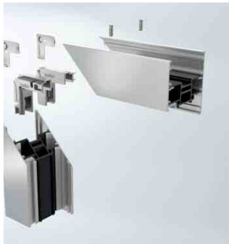
Schraubbare Eckverbinder als Option Screw-type corner cleats are an option