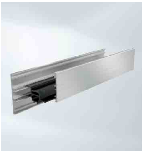
Schubloser Verbund zur Reduktion des Bimetall-Effektes Split insulating bar to reduce the bi-metallic effect